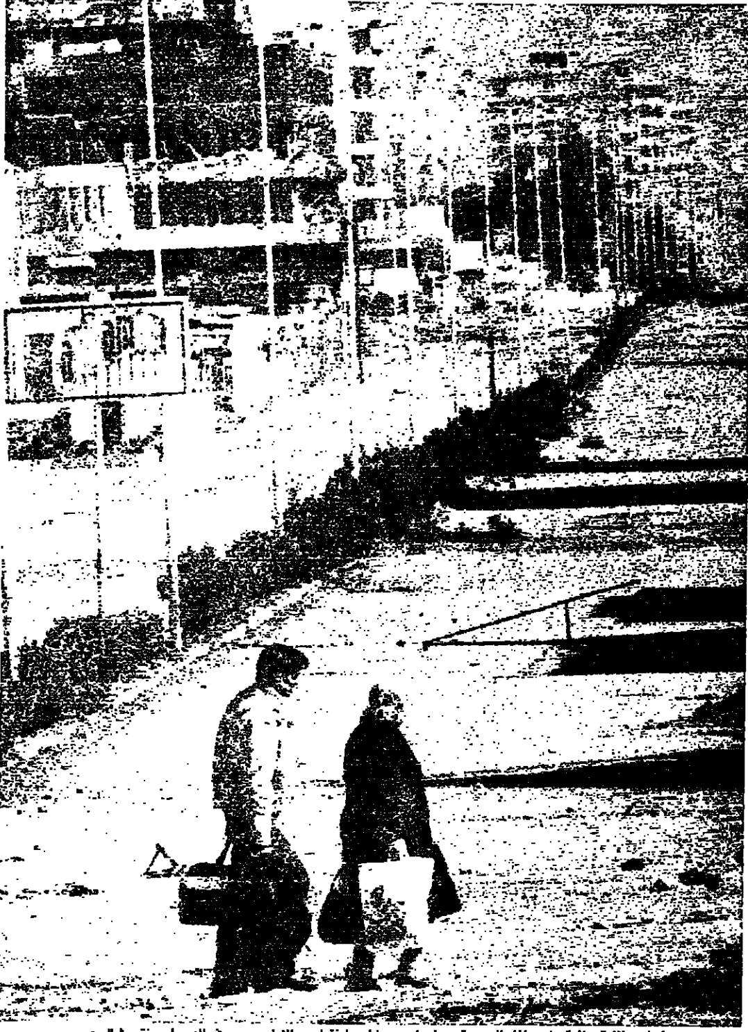
عيران ونظرة خاطرة على بولفار الجديدة حيث دارت معركة عنيفة أمس الأول، ويبدو في الوسط سجن شاموشي